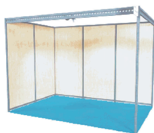
Exemple de stand (photo non-contractuelle)