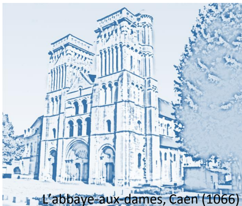
L'abbaye-aux-dames, Caen (1066)

Cette année, la Société Chimique de France Normandie et le Groupe Français d'Études et d'Applications des Polymères-Grand Ouest organisent les journées JNOEJC-GFP Grand Ouest à CAEN.